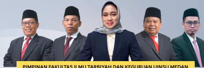
PIMPINAN FAKULTAS ILMU TARBİYAH DAN KEGURUAN UINSU MEDAN