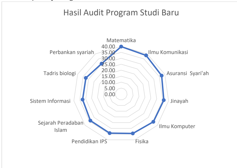
Tabel 8: Posisi Prodi Baru

Temuan dan hasil Audit Mutu Internal menunjukkan bahwa program studi baru disajikan pada gambar berikut: