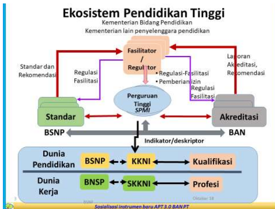
Gambar 1: Ekosistem Pendidikan Tinggi

Audit mutu internal dimaksudkan untuk meninjau tingkat kesesuaian dan efektifitas penerapan sistem manajemen mutu (SMM) yang telah ditetapkan. Hasilnya akan menjadi dasar untuk menentukan strategi dan sasaran mutu UIN SU Medan yang ingin dicapai dan tertuang dalam Manual Mutu. Pimpinan UIN SU Medan, Lembaga Penjaminan Mutu, dan Program Studi harus memastikan proses audit internal berjalan dengan efektif dan efisien untuk mengakses kekuatan dan kelemahan sistem manajemen mutu (SMM).